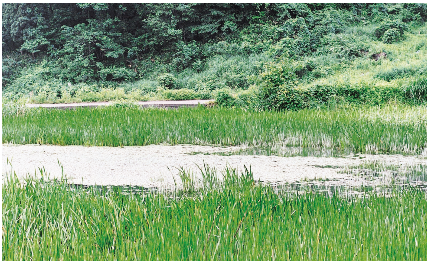
166. ヨシやガマなどの植物が多い池

トンボではありませんが、ゲンゴロウやガムシ、タガメなどもこのような池を好んで ほくせつ います。北摂地域では、モリアオガエルが産卵に来るのもこのような池が多いようです。トンボだけでなく、いろいろな生きものを観察してみましょう。